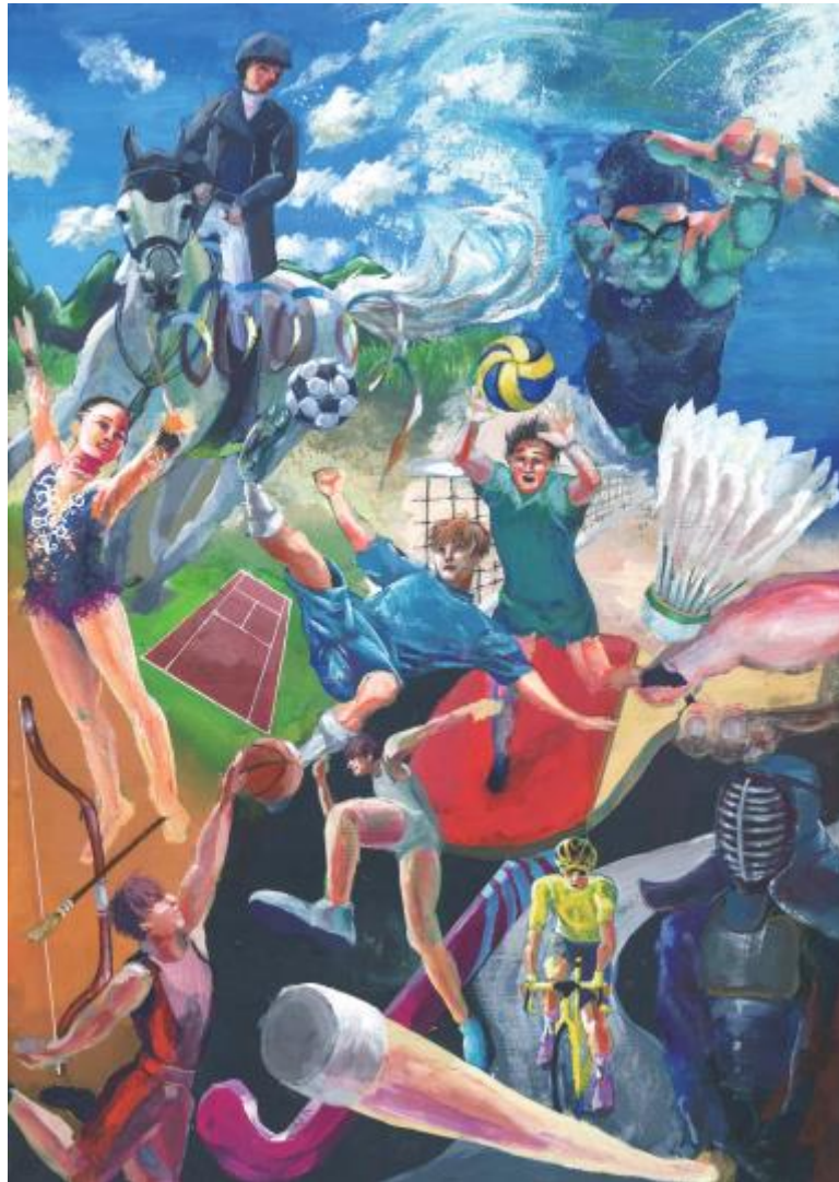
ポスター図案 木村 咲桜(大津)

期 日 令和4年6月3日(金) ~ 6月5日(日) 会 場 熊本県立菊池農業高等学校 馬術競技場